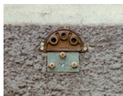
Plaques 3 trous ø 14 Buse ø 2,7