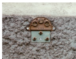
Plaques 3 trous ø 20 Buse longue ø 4