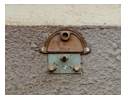
Plaques 1 trou ø 14 Buse courte ø 4