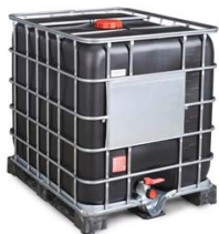
CUVE IBC 1000L NOIR ANTI-UV RECONDITIONNEE