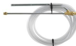
KIT DE SABLAGE DIAMETRE 035 MALE EURO