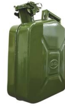
JERRICAN TÔLE HYDROCARBURE 10L