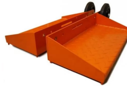
Jeu de marchepieds