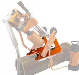
Kit angulaire pour perçage 45°