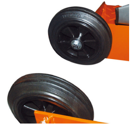
Jeu de roues