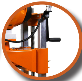
Guidage du chariot par Glissoirs téflon