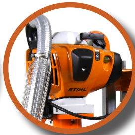
Nouveau Moteur 2 temps STIHL FS561 C 2,8 kW (3,8 Cv)