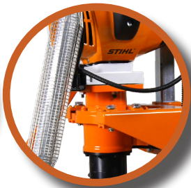
Réducteur GÖLZ planétaire sans entretien