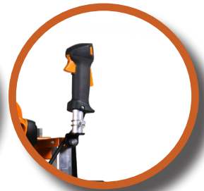
Poignée de Gaz Homme mort