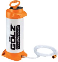
Pulvérisateur manuel 10 L Laiton PVC