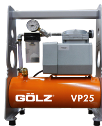
Pompe à vide VP 25