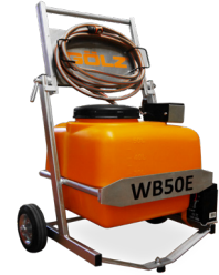
Pulvérisateur à Batterie WB50E 50 L Gardena