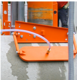
Kit plaques pour travailler par dépression