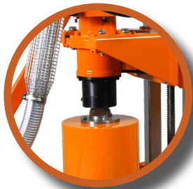
Raccord de couronne GÖLZ bride 3 trous

Inclus 1 pulvérisateur Acier 10 L raccord Laiton, 2 piquets de terre, 1 sangle 2,1 m avec cliquet, 1 flexible d'échappement de 4 M