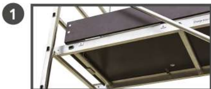
1 PLANCHER ÉQUIPÉ DE PLINTHES à poser sur les barreaux.