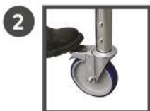
2 4 ROUES PIVOTANTES À FREINS de Ø 150 mm pour un déplacement sans effort.