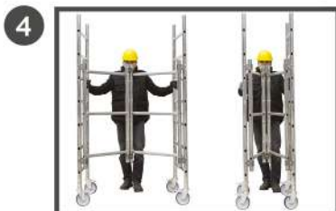
SYSTÈME DE PLIAGE DE LA BASE.