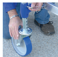
Roues diam. 200mm à blocage réglables sur 175 mm et tous les 12,5 mm