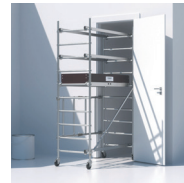
Passage de porte 93 cm