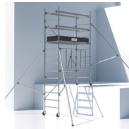
Décalage de niveau