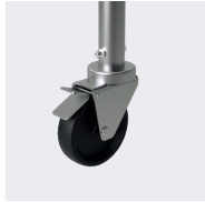
Roues Ø 125 mm. Blocage ultra-puissant des roues.