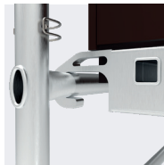
Crochets des plateaux ergonomiques