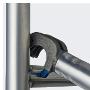
Système de liaison fiable en un seul geste