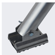
Platine de stabilisateur anti-dérivant orientable