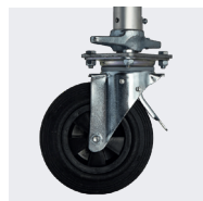
Roues Ø200mm à blocage réglables sur 175 mm et tous les 12,5mm