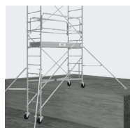
Décalage de niveau possible