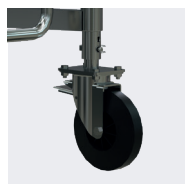
Roues Ø 200 mm réglables