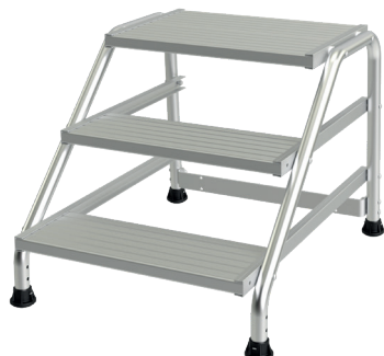
Modèle 3 marches

Ce marchepied tout en aluminium est disponible de 1 à 5 marches pour atteindre jusqu'à 3 mètres hauteur travail. Ses marches striées antidérapantes d'une largeur de 560 x 200 mm et sa plate-forme de 560 x 400 mm font de lui un des marchepieds les plus confortables du marché. Disponible avec roues en option.