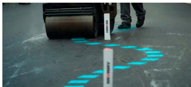
AWR 65-S Rouleau à guidage manuel avec angle de direction de 15°