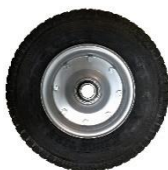
Ø 400 mm pour les remorques CU 2T et 3T 872 000 419 – Pour remorques CU 2T – 8 bars 872 000 427 – Pour remorques CU 3T – 10 bars

Bandages pneumatiques à profil industrie montés sur jantes alliage léger biflèches. Ces jantes permettent le changement aisé du bandage.