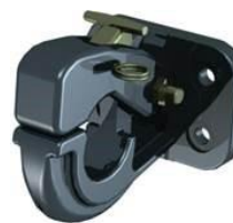
872 000 428 Pour remorques CU 5T