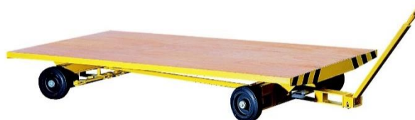
Sur fusées articulées - 2 essieux directeurs