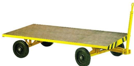
Sur couronnes à billes - 1 essieu directeur