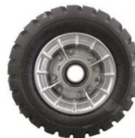
Ø 450 mm pour les remorques CU 5T 872 000 435 – Pour remorques CU 5T – 8,75 bars