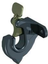
872 000 412 Pour remorques CU 2T et 3T

1 crochet arrière pour mise en train simple. Pas de possibilité d'inversion du sens de traction.