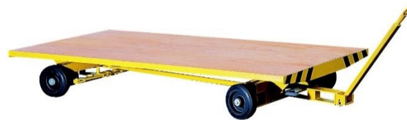
Sur fusées articulées - 2 essieux directeurs