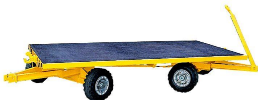
Sur couronnes à billes - 2 essieux directeurs