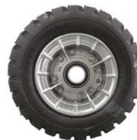
Ø 450 mm pour les remorques CU 5T 872 006 159 – pour remorques CU 5T – 8,75 bars