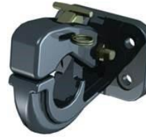
872 000 428 Pour remorques CU 5T