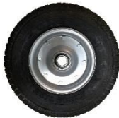
Ø 400 mm pour les remorques CU 2T et 3T 872 000 419 – pour remorques CU 2T – 8 bars 872 000 427 – pour remorques CU 3T – 10 bars

Bandages pneumatiques à profil industrie montés sur jantes alliage léger biflasques. Ces jantes permettent le changement aisé du bandage.