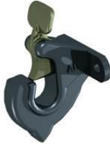
872 000 412 Pour remorques CU 2T et 3T

1 crochet arrière pour mise en train simple. Pas de possibilité d'inversion du sens de traction.