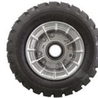
Ø 450 mm pour les remorques CU 5T 872 006 159 – pour remorques CU 5T – 8,75 bars