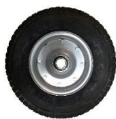
Ø 400 mm pour les remorques CU 2T et 3T 872 000 419 – pour remorques CU 2T 872 000 427 – pour remorques CU 3T et plateaux 2000 x 1000 ou 2520 x 1250 mm

Ces jantes permettent le changement aisé du bandage.