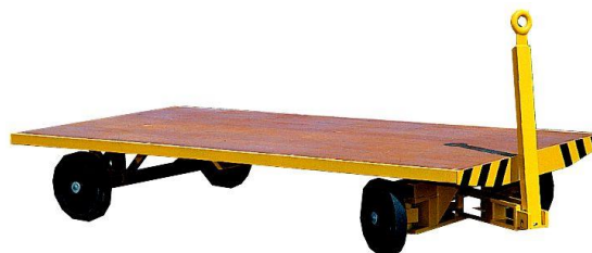
Sur fusées articulées - 1 essieux directeurs