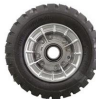
Ø 450 mm pour les remorques CU 5T 872 000 159 – pour remorques CU 5T 872 000 435 – pour remorques CU 5T et plateaux 3000 x 1500 ou 4000 x 1800 mm