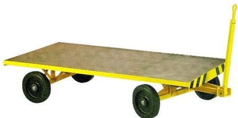
Sur couronnes à billes - 1 essieu directeur