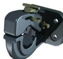
872 000 428 Pour remorques CU 5T