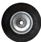
Ø 400 mm pour les remorques CU 2T et 3T 872 000 419 – pour remorques CU 2T 872 000 427 – pour remorques CU 3T et plateaux 2000 x 1000 ou 2520 x 1250 mm

Ces jantes permettent le changement aisé du bandage.