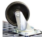
NY - Roues nylon CU 350 kg - Bandage dur pour sols lisses