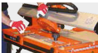
TÊTE INCLINABLE (0 À 45°)