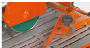
GUIDE DE COUPE AVEC RÉGLAGE DE L'ANGLE