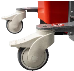
Roues à frein en polyuréthane