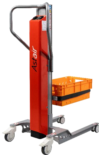
855 010 459 équipé de l'accessoire fourches