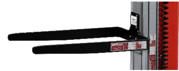
Fourches pour bacs à rebord - 855 010 463 Longueur : 480 mm Largeur intérieure : 272 mm Largeur extérieure : 288 mm