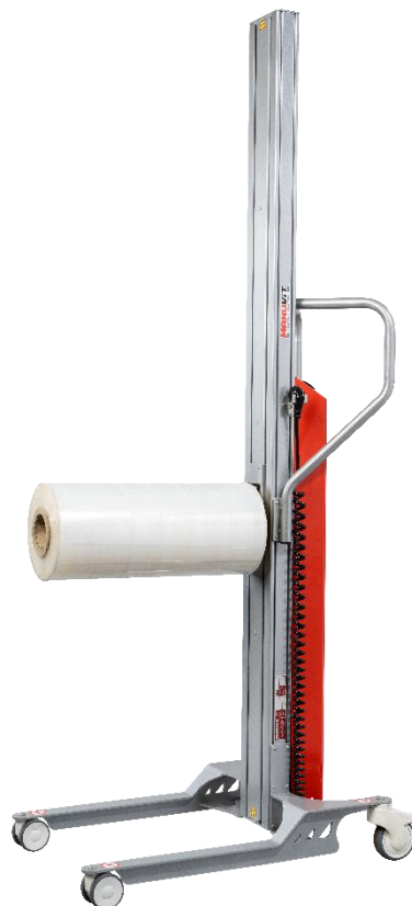
855 010 461 équipé de l'accessoire éperon