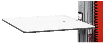
Plateau en stratifié haute pression (HPL) - 855 010 464 Dimensions : 500 x 500 mm Adapté pour une utilisation dans l'industrie chimique, l'agroalimentaire et le pharmaceutique.