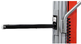
Éperon à galet - 855 010 462 Pour bobines alésage Ø 45 mm Longueur : 430 mm