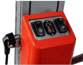
Indicateur de charge