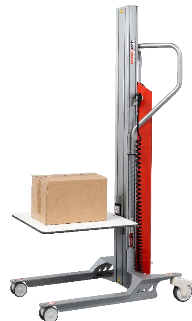
855 010 460 équipé de l'accessoire plateau