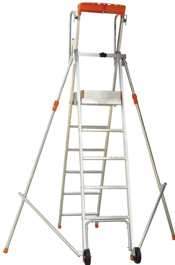
835 007 673 – 6 marches