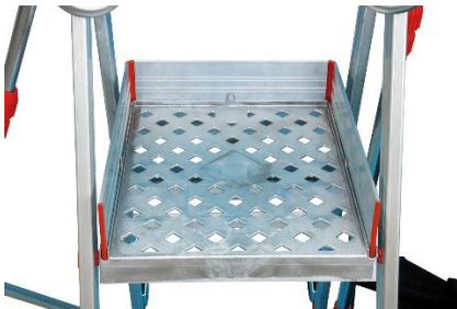
Plateforme supérieure de 405 x 510 mm