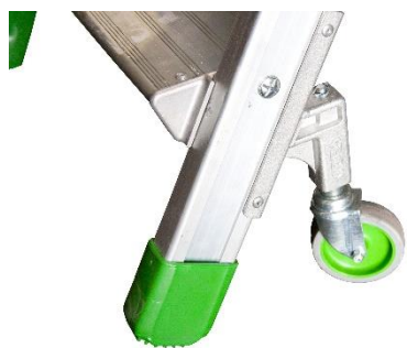
Système d'immobilisation automatique