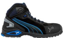
RIO BLACK MID 632250