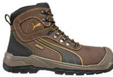
SIERRA NEVADA MID 630220