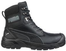
CONQUEST BLACK CTX HIGH 630730