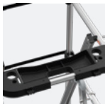
Tablette porte-outils amovible