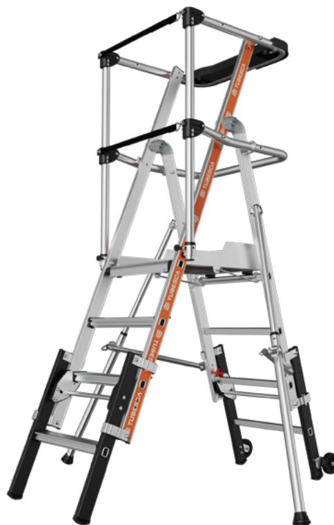
Raptorscopie garde-corps Sangles 3/4 marches