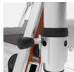
Système de repliement des garde-corps