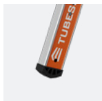
Sabots entrants antidérapants