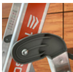
Articulations monoblocs robustes