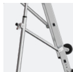
Stabilisateurs à réglage millimétrique

La marque NF certifie la conformité à la norme NF P 93-353 (modèle 3-4 marches), à la norme NF P 93-352 (modèle 5-7 marches) et au Référentiel NF096.