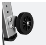
Roues de déplacement Ø100 mm